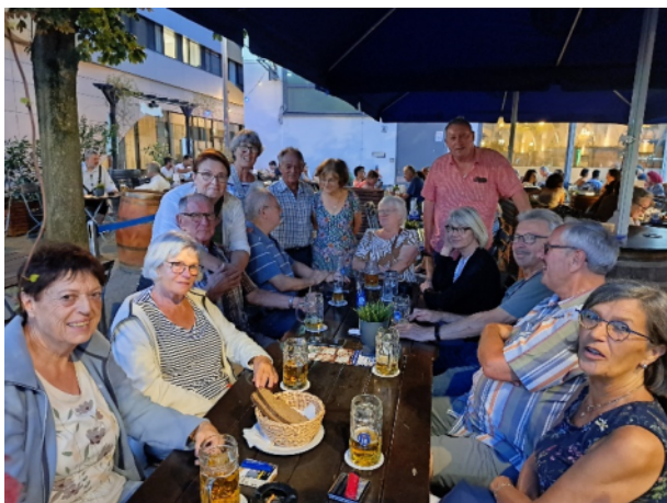
Mehrtagestour August 2024 - Berlin