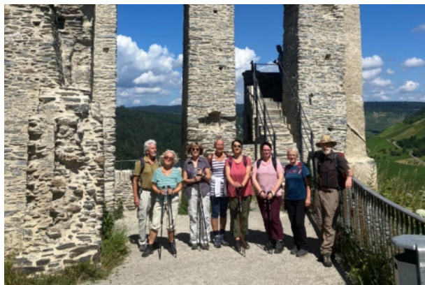
Sonntagswanderung Juli 2024 – Franzosensteg (G. Schenk)