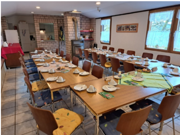
Jahreshauptversammlung 2024 im Vereinshaus