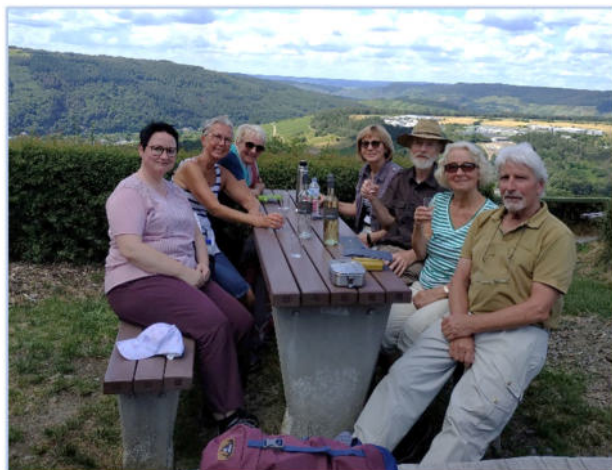
Sonntagswanderung Juli 2024 – Franzosensteg (G. Schenk)