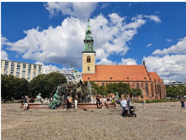
Mehrtagestour August 2024 - Berlin