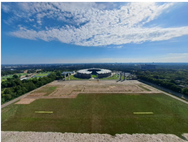
Mehrtagestour August 2024 - Berlin