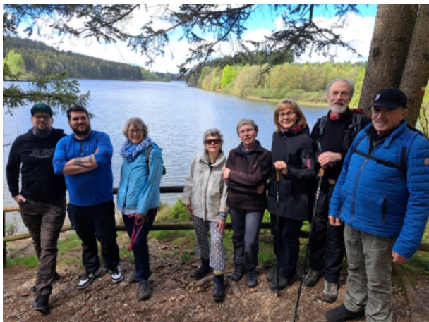
Sonntagswanderung Mai 2024 - Bütgenbach (KH. Schlifter)