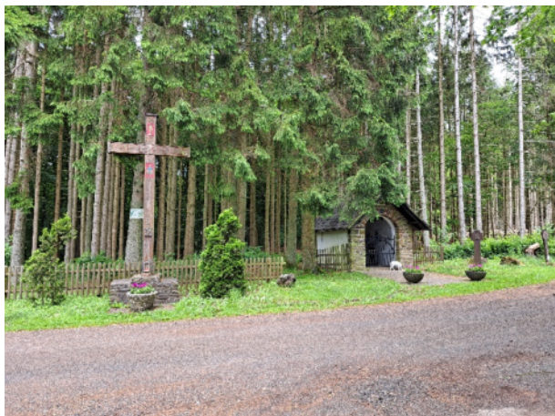
Sonntagswanderung Juni 2024 - Afelskreuz (KH.Schlifter)