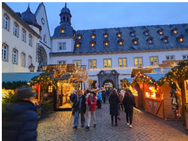
Weihnachtsmarkt in Koblenz 2024