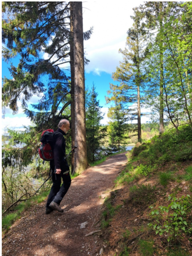
Sonntagswanderung Mai 2024 – Bütgenbach (KH Schlifter)