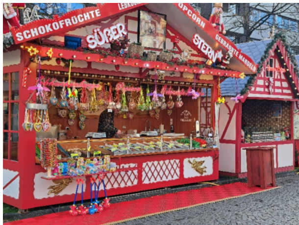
Weihnachtsmarkt in Koblenz 2024