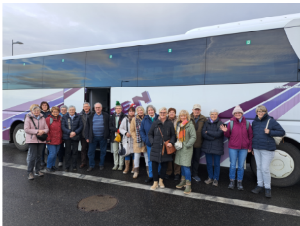
Teilnehmer Tagesfahrt zum Weihnachtsmarkt in Koblenz 2024