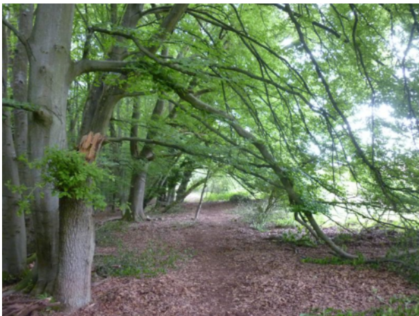
Foto Juni - Sonntagswanderung Longuicher Sauerbrunnen