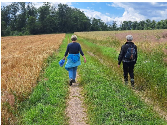
Donnerstagswanderung Juli 2024 (KH.Schlifter)