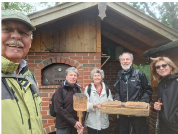
Sonntagswanderung Juni 2024 - Afelskreuz (KH.Schlifter)