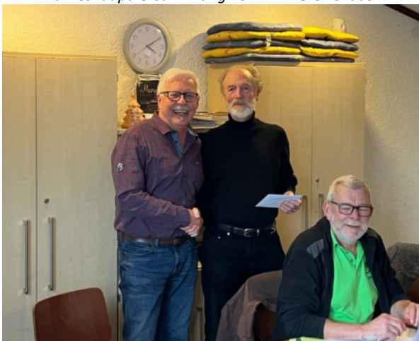
Jahreshauptversammlung 2024 im Vereinshaus