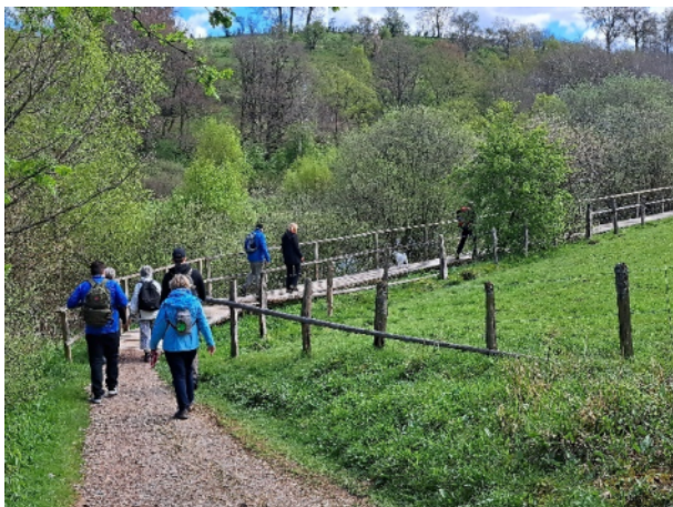
Sonntagswanderung Mai 2024 – Bütgenbach (KH Schliffter)