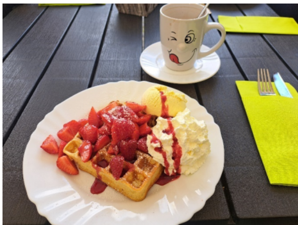
Donnerstagswanderung Juli 2024 (KH.Schlifter)