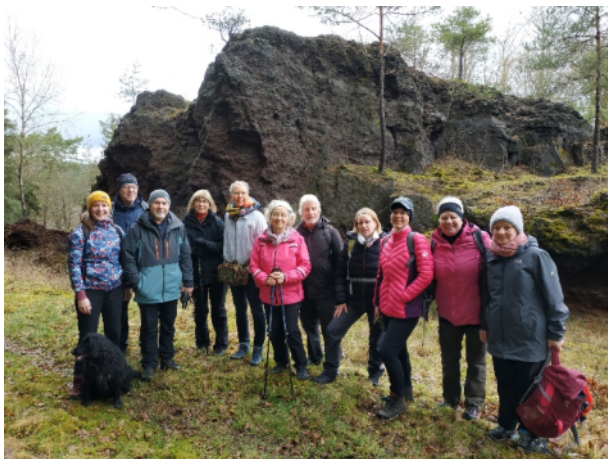
Sonntagswanderung Februar 2024 (G. Schenk)