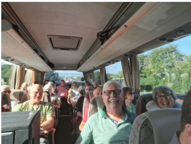
Mehrtagestour August 2024 - Berlin