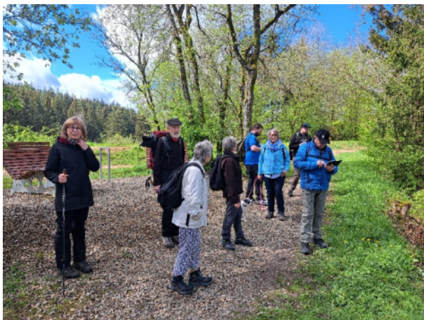
Sonntagswanderung Mai 2024 - Bütgenbach (KH Schliffter)